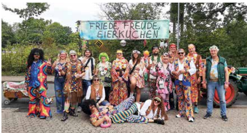
"Friede, Freude, Eierkuchen ...": Unter diesem Motto versetzte die Gemeinschaft Nienhagen-Nienhorst (Kgr. Celle) ihren Umzugswagen in die Hippiezeit der 70iger Jahre. Beim diesjährigen Hachumzug sorgten die VWE-Mitglieder im September mit schrillen, leuchtenden Farben für "den Hingucker". Spaß und Kreativität, mit denen die VWE-Mitglieder dabei waren, waren unübersehbar.

In Folge 6 des VWE-Podcasts "Deine Hausflüsterer" widmet sich Landesgeschäftsführer Tibor Herczeg dem Thema " Wasser im Garten: Sammeln, speichern, sparen " (Info: www.meinVWE.de ).